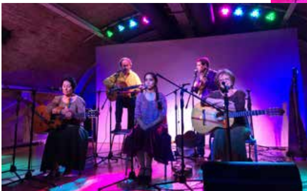
Procesión de Lucia, canto del coro chileno sueco y del grupo folclórico Cuncumén.