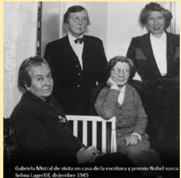
Gabriela Mistral de visita en casa de la escritora y premio Nobel sueca Selma Lagerlöf, diciembre 1945

https://www.facebook.com/events/576892413545273