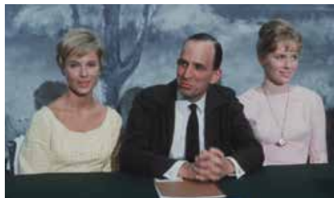
Bibi Andersson, Ingmar Bergman y Liv Ullmann en la conferencia de prensa para Persona, 1965.

La crítica, los teóricos y estudiosos del cine vieron en él un artista de singular categoría, con una gran capacidad de presentar, a través de sus imágenes reflexiones profundas acerca del dolor, del paso del tiempo, de la memoria y el olvido. Así como la soledad, la incomunicación y la imperiosa necesidad de creer. Siempre presente la ausencia de Dios, uno de sus temas recurrentes, en medio de la luz mortecina propia de los países nórdicos, y que él identificaba con el concepto de "la noche oscura de alma".