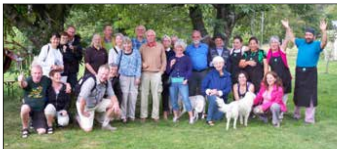
Recuerdos de un bello día en Malalcahuello.

L OS ALREDEDOR DE CIENTO SUECOS que viajaron por Chile conmigo como guía los últimos dos años, han regresado a Suecia conmovidos y enamorados. Enamorados del paisaje, de la gente, del mar, de la cordillera. Conmovidos por La Moneda, el Museo de la Memoria, por los cerros de Valparaíso, la iglesia de la Matriz, su cura y su historia, por Isla Negra, por las viñas del Valle de Colchagua, por las araucarias de Malalcahuello y por mucho más. Pero lo que más profundamente los ha conmovido ha sido