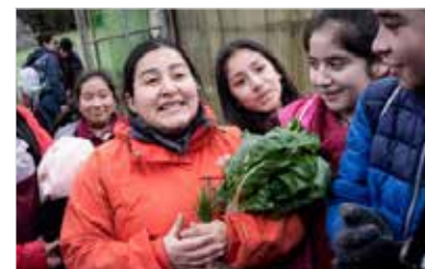
Rallén con alumnos en AulaViva.

seguir mi vida a la sueca; caminar en el bosque mano a mano con Ronja Rövardotter en búsqueda de Skogsmulle”.