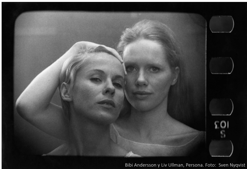
Bibi Andersson y Liv Ullman, Persona.