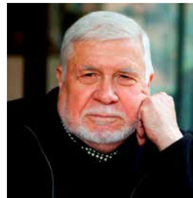
Poli Délano

acostumbraba a tomarse un whisky, su bebida preferida. Poli Délano se parecía físicamente a Hemingway. Su inteligencia irónica y su vasta cultura plagada de humor nunca cojeaban. Era un escritor consciente y directo. Franco y cultivador de la conversación y la amistad. Le llevé uno de sus libros, El verano del murciélago , para que el maestro me lo autografiara. Hablamos de esa nouvelle y la comenté como si recién la hubiese escrito. También hablamos de por qué sus libros extrañamente no estaban traducidos al sueco, aunque Poli Délano, después del golpe militar había vivido seis meses en Estocolmo y aunque él tenía muy buenas relaciones con Suecia. Su padre, el prolífico escritor Luis Enrique Délano , había sido embajador en Suecia durante el gobierno de Salvador Allende, entre 1970 y 1973.